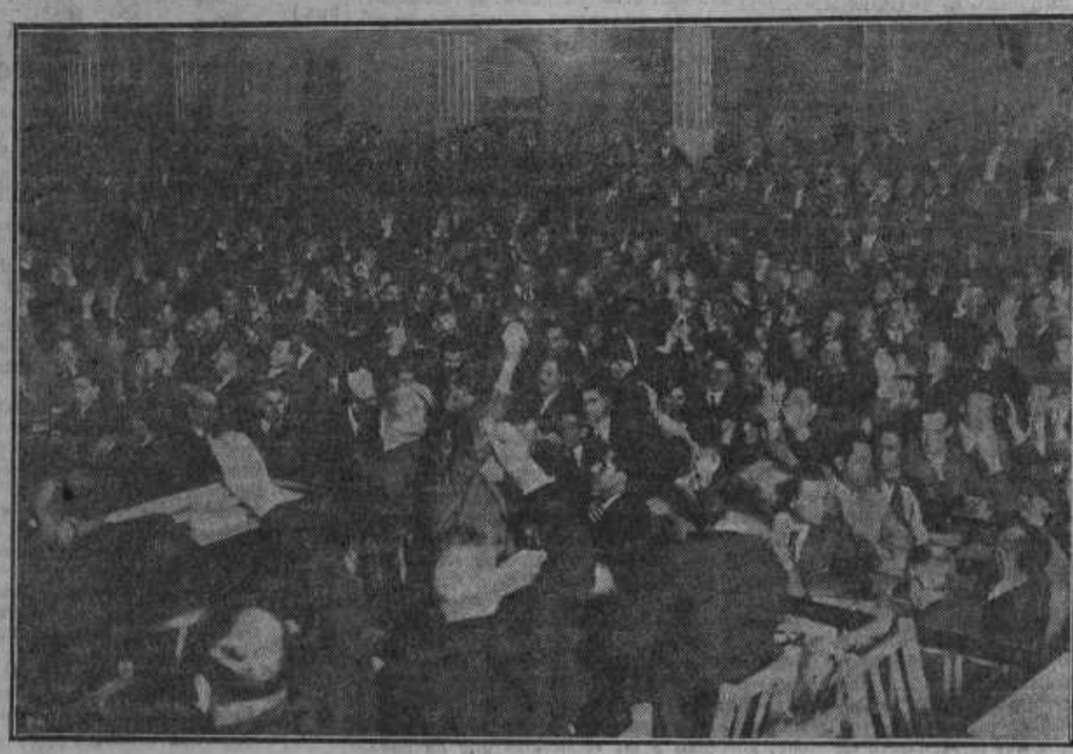
Un rincón de la asamblea durante una votación.

nombrar—añade—una Comisión que revise las credenciales presentadas. En otras ocasiones esta Comisión ha estado compuesta de los primeros delegados que han presentado la suya. Son los de San Fernando, de Hérores, Alcobendas, Orusco, Coín, Perturman, Montforte de Lemus, Guadalupe, Tetuán (Marruecos), Carabanchel Bajo, Yeste, Chamartín de la Rosa y Barruelo de Santulmán. Se decide, por aclamación, que sean los delegados de estas Secciones los que compongan la Comisión de credenciales.